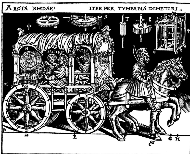
Fig. 1 | Di Lucio Vitruvio Pollione de architectura libri dece traducti de latino in vulgare affigurati: commentati et con mirando ordine insigniti [...] , Como, Gottardo da Ponte, 1521, c. 174r (sfondo elaborato).

Per dirla più chiaramente: non ci interessa nemmeno l'illustrazione in sé stessa, bensì la sua correlazione con i paratesti verbali che contiene. In riferimento alla traduzione e al commento accanto a cui compaiono, questi paratesti costituiscono un elemento alloglotto, che per quanto riguarda la semplicissima sintassi e la funzione autoriale, ricorda i titoli latini di tante opere volgari dell'epoca e/o le intestazioni latine dei loro capitoli (per entrambi i fenomeni si veda per esempio il De principatibus , comunemente Il Principe , di Niccolò Machiavelli).