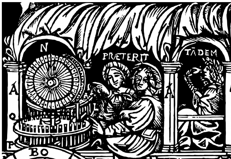
Fig. 2 | Di Lucio Vitruvio Pollione de architectura libri dece traducti de latino in vulgare affigurati: commentati et con mirando ordine insigniti [...] , Como, Gottardo da Ponte, 1521, c. 174r, dettaglio (sfondo elaborato).

Carol Herselle Krinsky (per quanto ne so l'unica che finora abbia dedicato alla figura una breve analisi) sottolinea giustamente il clima festivo del viaggio in carrozza e la presenza dello stemma sforzesco con il serpente posto in alto sul veicolo, a cui si aggiunge l'aquila posta al di sotto; alla studiosa americana sfugge però completamente la connessione che si stabilisce tra le "gentle maidens" e il "griffin smiling at the horseman", e le parole sovrastanti che Krinsky neppure menziona (Krinsky 1969, 27